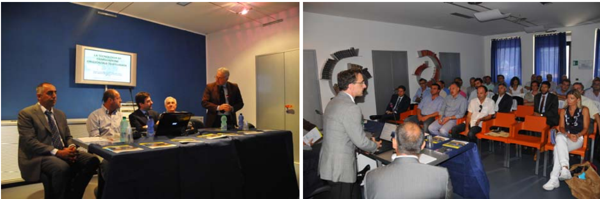
Alcune immagini del convegno di inaugurazione del sottopasso del fiume Ombrone e di presentazione del progetto da parte di GEA al Comune di Grosseto ed a una platea di tecnici intervenuti per l'occasione

costruzioni (a cui la posa di condotte è assimilabile) prevede una garanzia del costruttore sull'opera pari a 10 anni.