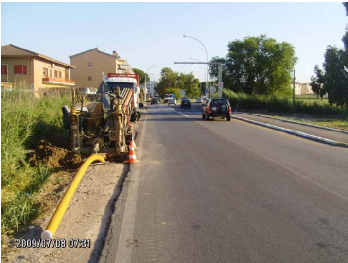
Una fase intermedia della posa, appena fuori dell’abitato di Grosseto. Da sottolineare che un solo scavo è stato eseguito in campo stradale sull’intero sviluppo dei circa 3000 metri di posa

I tempi di realizzazione delle opere si attestano attorno al 50% in meno rispetto agli interventi tradizionali, rendendo quindi possibile una corrispondente riduzione dei disagi al traffico veicolare ed alle attività commerciali ed agricole insistenti lungo il tracciato.