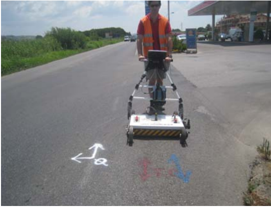
Una fase della battuta Georadar lungo il tracciato prefissato per la posa della condotta

I sottoservizi già presenti nel sottosuolo sono stati preventivamente segnalati dagli Enti proprietari, ma data la tecnica di posa “non a vista”, la loro posizione precisa è stata verificata nel dettaglio mediante il Georadar, altra tecnica di avanguardia che consente di “guardare” al di sotto dell’asfalto alla ricerca di tubazioni e manufatti occulti.